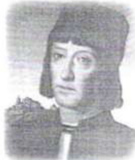
Vicente Yáñez Pinzón