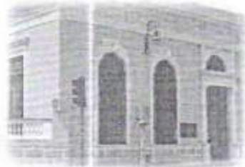
Instituto Benjamín Franklin