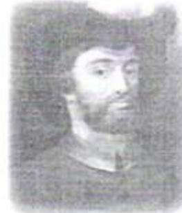
Martín Alonso Pinzón

Navegantes españoles del siglo XVI que participaron en el descubrimiento de América. Se dedicaron al tráfico marítimo. Al conocer a Colón y su plan de viaje, Martín Alonso, el mayor, aceptó viajar con él e incluso le proporcionó a Colón barcos, hombres y dinero. Fue el capitán de La Pinta, pero durante la travesía se enemistó con Colón y desobedeciendo sus órdenes llega a La Española. Posteriormente regresa a España donde muere. Su hermano Vicente (quien muere en 1519) ya había viajado con Colón en el primer viaje de éste a bordo de La Niña. En 1499 consiguió que en las Capitulaciones le concedieran volver a Las Indias. Llega a Brasil siendo su descubridor y el primero en atravesar el Ecuador. Descubre la desembocadura del río Amazonas y la insularidad de Cuba; navega hasta Yucatán y la costa centroamericana. Sus últimos días los pasó en Sevilla. El hermano menor de los Pinzón, Francisco Martín, fue el contraalmirante de La Pinta. En 1508 participa en la Junta de Burgos cuyo objetivo era reclutar a expedicionarios hacia Centroamérica y descubrir un canal o un paso interoceánico para llegar a las islas de las Especies. Yáñez y Solís salieron escogidos y partieron con una nao y una carabela el 23 de marzo de 1508; salen de Sevilla, recorren la costa de Nicaragua hasta alcanzar la costa oriental yucateca y no encontrando canal alguno, regresan a España en octubre de 1509.