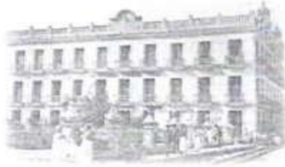
El Gran Hotel