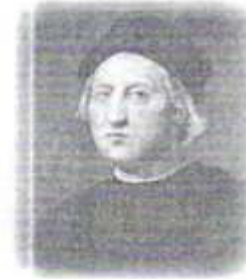
El 11 de octubre de 1492, Cristóbal Colón desembarcó en las playas de una isla de las Bahamas, desplegó el estandarte real español y se armó el territorio para los reyes Católicos

El cuarto y último viaje de Cristóbal Colón a tierras americanas fue de grandes calamidades, limitaciones, frustraciones y pérdidas. Esto fue debido a que en su tercer viaje hubo descontentos tanto de españoles como de indígenas, unos porque no encontraban las riquezas prometidas y otros por los maltratos hacia ellos, pero todos contra Colón provocando disturbios que llegan a oídos de los Reyes de España, por lo que lo apresan, lo enjuician en España y pierde títulos. La reina Isabel "La Católica" lo libera y Colón inicia el cuarto y último viaje el 3 de abril de 1502 saliendo del puerto de Sevilla con dos carabelas: Santa María y Santiago. Se dice que se embarcaron 139 hombres de los cuales, 39 no regresaron nunca a España, 35 fueron muertos en batallas, 4 desertaron y se asentaron en estas tierras. Llega el 29 de junio (1502) a Santo Domingo y se encuentra con que Nicolás de Ovando era el nuevo gobernador y quien siguiendo instrucciones de los Reyes de España, le prohíbe desembarcar en Santo Domingo, de hecho Colón tenía prohibido tocar tierra española; para conseguir de nuevo la venia española, es que Colón se propone encontrar un estrecho: