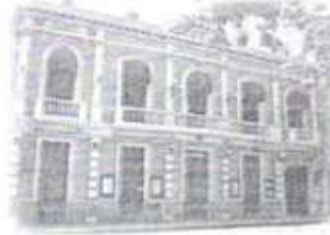
Teatro Peón Contreras