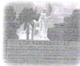
Los sanjuanistas querían una reforma en la educación y que también se extendiera en la población indígena.