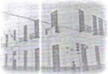
Biblioteca Pública Central Estatal "Manuel Cepeda Peraza"