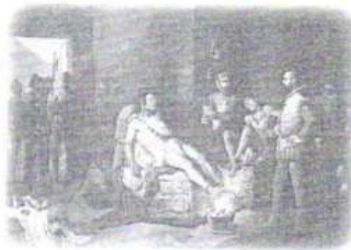
Tortura de Cuauhtémoc