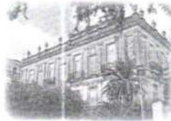
Las Casas Cámara

Durante el Porfiriato, Mérida también se llenó de problemas sociales de la época como la criminalidad, la prostitución, un incremento de delitos de diversa índole, desde simples robos hasta homicidios; todo esto despertó gran preocupación entre los yucatecos de la capital. Esto es fácil de observar en diversos artículos de la época que trataban ese fenómeno social, que no sólo afectaba al sector más privilegiado económicamente de la sociedad, sino también a otros estratos como artesanos, comerciantes, estudiantes y