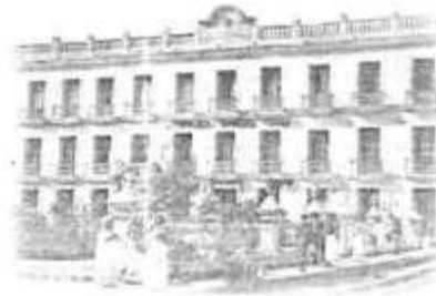
Porfiriato en Yucatán