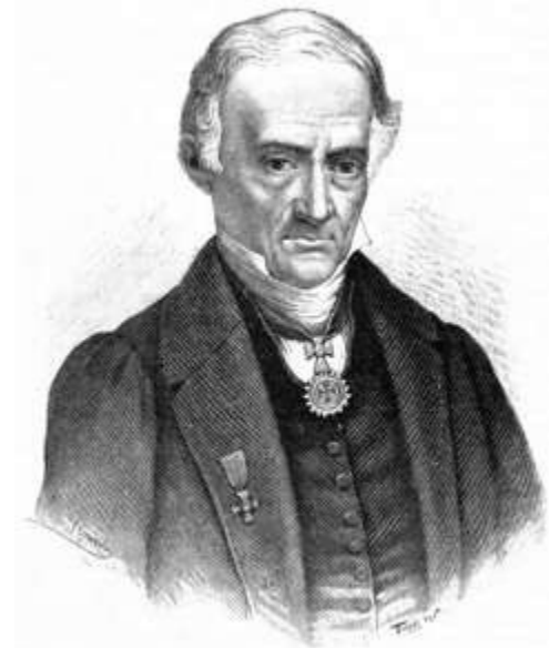
Don Andrés Quintana Roo

El 16 de marzo de 1841 estando en junta el primer ayuntamiento constitucional de Mérida, irrumpió en la sala un grupo de personas encabezadas por Miguel Barbachano y Terrazo (futuro gobernante de Yucatán). Sin violencia y sin armas solicitan al Cabildo que se haga la petición al Congreso, requiriendo la independencia de Yucatán. Al aceptar el ayuntamiento se desató la euforia del grupo y se dice que hubo un atronador y unánime aplauso. Dentro de esa euforia algunos miembros del grupo arriaron la bandera mexicana sin medir las consecuencias y enarbolaron en su lugar un pabellón que se llamó yucateco. Oficialmente unos días después se removió el lábaro mexicano de barcos y edificios en favor de la bandera yucatanense.