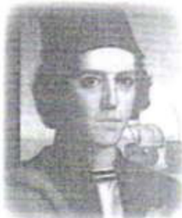
Juan Díaz de Solís

Muerto en 1516, Díaz de Solís formó parte de un grupo de expedicionarios que llegó a América por intereses científicos. En 1508 se unió a Vicente Yáñez Pinzón. En 1512 le concedieron capitulaciones para viajar a Río de la Plata. Como científico, su objetivo era recoger datos y con ellos elaborar un mapa de la zona. Dicho objetivo fue un encargo de la Casa de Contratación. Este mapa sería fundamental para la expedición de Magallanes. Díaz de Solís sería el piloto mayor gracias a su experiencia náutica en Portugal.