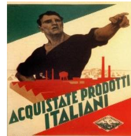
Propaganda fascista: “Compre productos italianos”.

Durante su gobierno Mussolini “ el Duce ” se caracterizó por establecer el sistema totalitario, lema: Todo para el Estado, nada contra el Estado, nada fuera del Estado”.