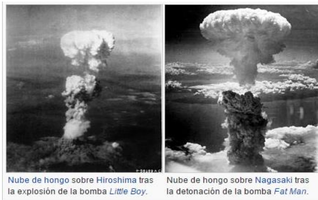
Nube de hongo sobre Hiroshima tras la explosión de la bomba Little Boy .

El descubrimiento de la energía atómica se hizo a lo largo del siglo XIX y en las tres primeras décadas del siglo XX. Durante la Segunda Guerra Mundial se creó el proyecto Manhattan con el fin de desarrollar la primera arma nuclear antes que los alemanes, este proyecto dio como resultado la creación de las bombas atómicas que se explotaron en Hiroshima y Nagasaki.