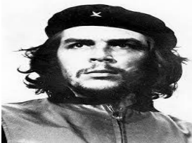
Ernesto Che Guevara

Hasta la fecha, los ideales revolucionarios son parte de Cuba, que se considera el único país que mantiene el socialismo plenamente vivo. Con el empeoramiento en el estado de salud de Fidel Castro en 2007, Raúl Castro, su hermano, pasó a gobernar oficialmente Cuba en febrero de 2008.