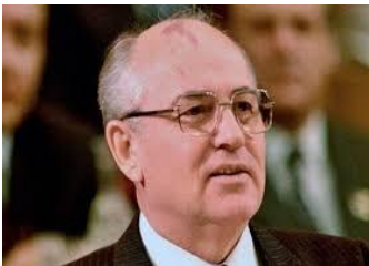
Mijael Gorbachov impulsor de la perestroika (transformación económica) y el glasnost (transparencia informativa) en la Unión Soviética.

El resultado de la política fue que el régimen se debilitó y se generó un vacío de poder, que llevó a la desintegración del bloque socialista a partir de 1989, cuando fueron derrocados los gobiernos prosoviéticos en Polonia, Hungría, Alemania Democrática, Bulgaria, Rumania y Checoslovaquia. Ese año desapareció el Muro de Berlín y Alemania se reunificó. En 1990 dejó de existir el Pacto de Varsovia en tanto que Estonia, Letonia y Lituania (países bálticos) se independizaron. En 1991 la desintegración continuó con la proclamación de la autonomía de las naciones como Moldavia, Ucrania, Turkmenia, Tayikistán, Bielorrusia, Kazajstán, Uzbekistán, Armenia, Azerbaiyán, Georgia, Kirguizia. La transformación culminó cuando el gobierno central ruso desintegró el sistema socialista y lo sustituyó por uno capitalista.