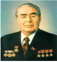
Leonid Brezhnev gobernó la Unión Soviética de 1964 a 1982

Al tiempo de gobierno de Brezhnev le corresponde el llamado Período de Distensión consiste en la normalización de las relaciones con Alemania Occidental, en 1970, y el acuerdo cuatripartito sobre Berlín, en 1971. Participó en los acuerdos SALT, en 1972 y SALT II, en 1973. En 1979 invadió Afganistán lo que trajo de vuelta un período de tensión entre países capitalistas y socialistas.