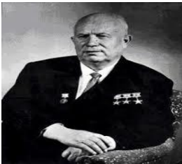
Nikita Krushev líder soviético en la época de la crisis de los misiles

A la muerte de Stalin, en 1953, Nikita Krushev ocupó el poder. Durante su gobierno se dio la llamada Crisis de los misiles entre Estados Unidos y la Unión Soviética (1962), la cual puso al mundo al borde de la guerra nuclear. Entrados en razón, ambos países llegaron a un acuerdo, por lo cual decidieron negociar sobre la fabricación y uso adecuado de los misiles de largo alcance.