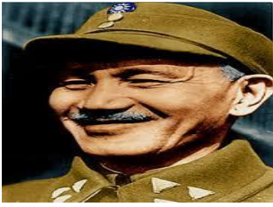
Chiang Kai Chek