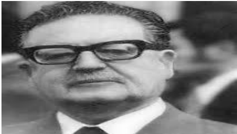
Salvador Guillermo Allende Gossens

La presión popular cada vez era mayor para que el gobierno iniciara una transición democrática. En 1988 se realizó un plebiscito para decidir sobre la continuidad de Augusto Pinochet como presidente de la República: ganó el “NO” a Pinochet y al año siguiente se convocaron las primeras elecciones democráticas.