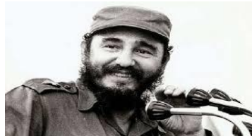
Fidel Castro Ruz