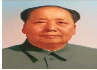
Mao Tse Tung