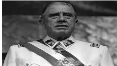
Augusto José Ramón Pinochet Ugarte