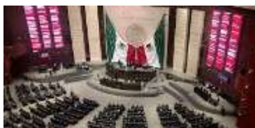
Cámara de diputados

El proceso legislativo se encuentra establecido en nuestra Constitución Política en sus artículos 71 y 72, y se integra en seis etapas o fases, participan el Congreso de la Unión, integrado por las dos Cámaras: Diputados y Senadores, así como el Presidente de la República.