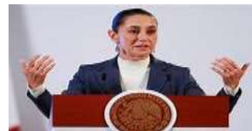
Presidente de la República 2024-2030