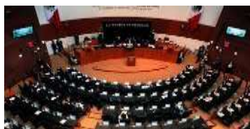
Cámara de senadores